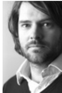
Peter Kunz Fotograf

Schwerpunkte: Ökologie & Design, Forschendes Sehen, Klassisches Zeichnen, Maltechniken, Naturschulung - LandArt, Phantasie- und Erfinderschmiede, Ausstellungskonzeption